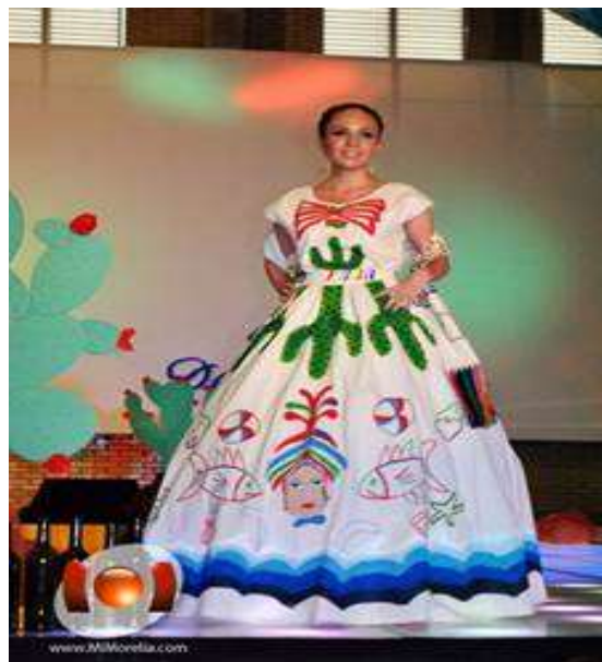
Vestido regional de Baja California Sur.

del mundo; asimismo, se realizaron importantes obras de infraestructura, como el aeropuerto de La Paz, la carretera La Paz-Valle de Santo Domingo, los hospitales de San José del Cabo y Todos Santos, el edificio de gobierno en Loreto, la construcción y pavimentación del malecón "Paseo Álvaro Obregón" de La Paz y el edificio de la Escuela Normal Urbana; así como la pavimentación de las principales calles de la capital sudcaliforniana; destacando en el aspecto educativo y deportivo, el establecimiento de albergues escolares rurales y las entonces olimpiadas territoriales, hoy denominadas estatales, para propiciar la unidad de las diferentes regiones de Baja California Sur, Asimismo, en 1951 mediante un concurso auspiciado por la señora Ana María Borbón de Olachea, fue elegido como traje regional de Baja California Sur, el denominado "Flor de Pitahaya", diseñado por los señores Manuel Torre Iglesias y Susana Hiérrales, con el propósito de fomentar la identidad y valores sudcalifornianos; siendo que en dicho período se instituyeron los desayunos escolares y el sistema de guarderías.